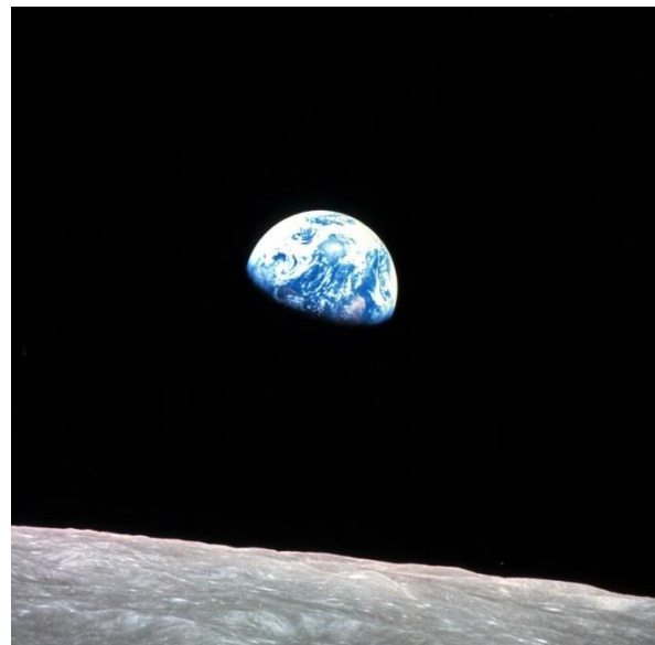
Afbeelding 3: Earthrise