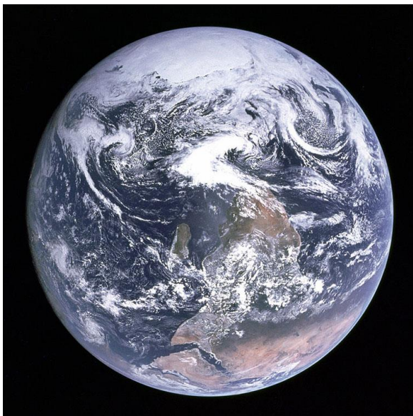
Afbeelding 2: The Blue Marble